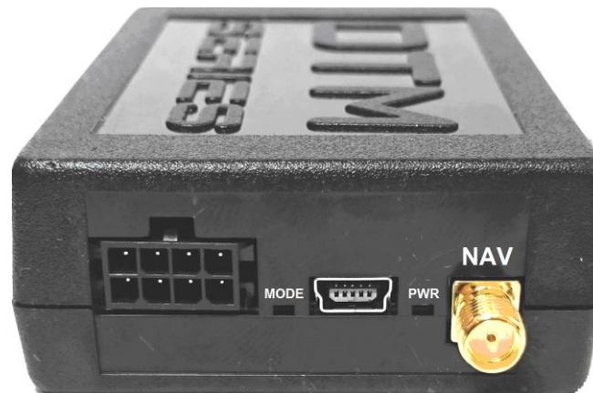
Рис 3. Передняя панель прибора.

NAV - разъем для подключения внешней антенны GPS/GLONASS.