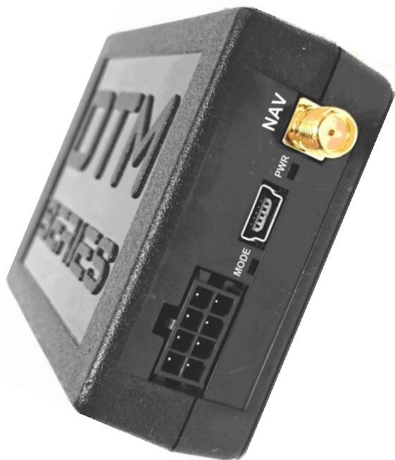
Рис 1. вид сверху на устройство.